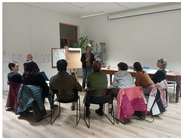
Immagini 10-11 Lavoro in sottogruppi