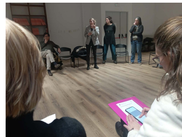
Immagine n. 1-2 Gruppo dei partecipanti