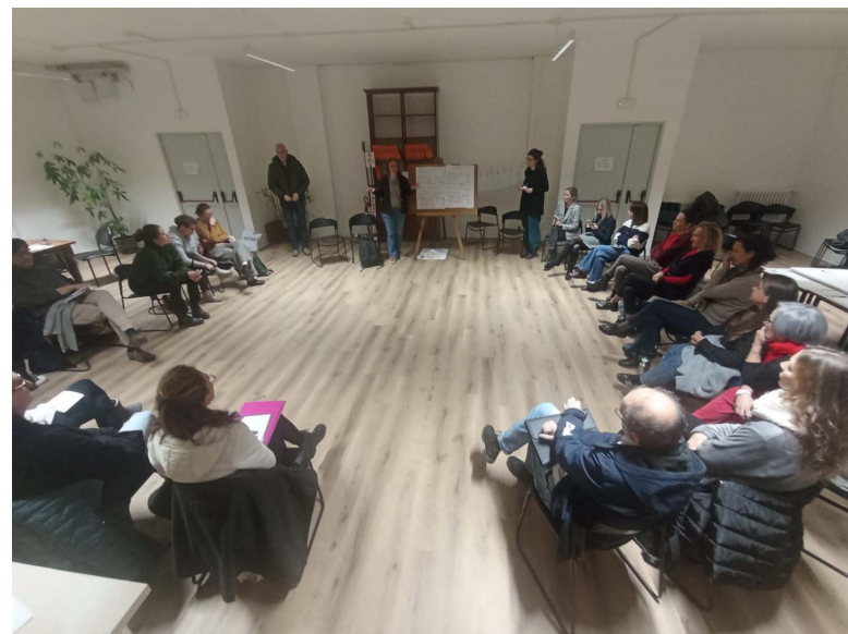
Immagini n. 12-13-14 Momenti di confronto durante l'incontro