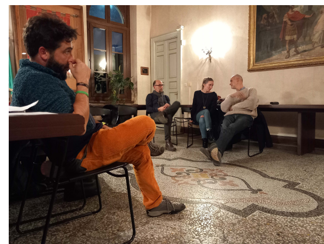
Immagini n. 2-3 Momento di presentazione