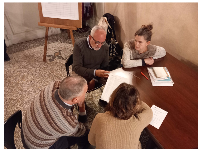
Immagini n. 4-5-6 Momento di lavoro in sottogruppi