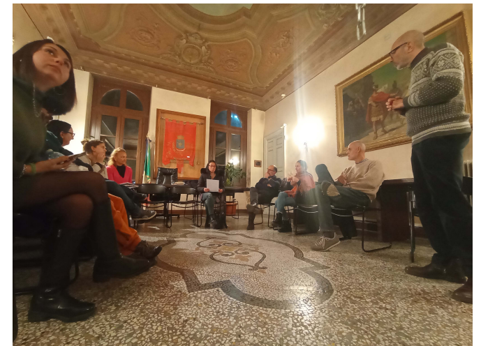
Immagini n. 7-8-9 Momenti di confronto durante l'incontro